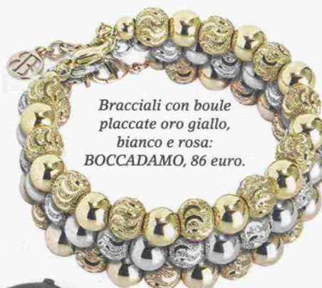
Bracciali con boule placcate oro giallo, bianco e rosa: BOCCADAMO, 86 euro.