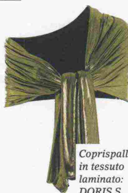
Coprispalle in tessuto laminato: DORIS S, prezzo su richiesta.