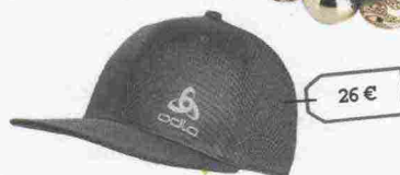
Cappellino argento con visiera: ODLO, 26 euro.