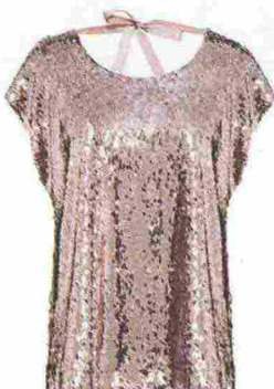
Top rosa con schiena nuda: LANACAPRINA , 138 euro.