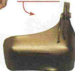
Bikini bronzo con reggiseno monospalla e slip con laccetti: VERDISSIMA , 59+33 euro.