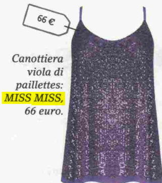
Canottiera viola di paillettes: MISS MISS, 66 euro.