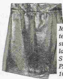
Minigonna in tessuto tecnico stampato effetto lamé specchiato: SUNCOO PARIS, 100 euro.