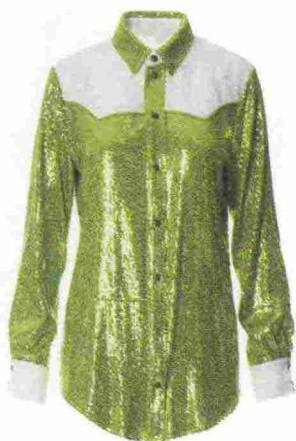
Camicia di paillettes modello cow girl: KATE BY LALTRAMODA , 159 euro.