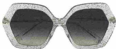
Occhiali da sole con montatura glitterata: FURLA BY DE RIGO VISION , 149 euro.