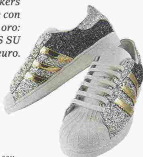
Sneakers glitterate con strisce oro: ADIDAS SU EBAY, 149 euro.