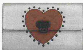
Pochette in eco pelle con cuore: NUMEROVENTIDUE, 69 euro.