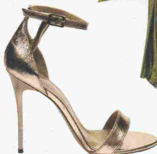
Sandali metallizzati con tacco a spillo: FELEPPA, 195 euro.