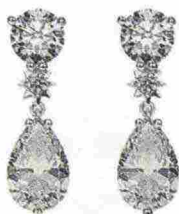
Orecchini a chandelier con zirconi sintetici: THOMAS SABO , 129 euro.